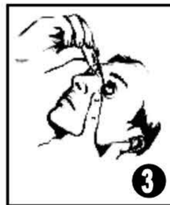
Retourner le flacon, appuyer légèrement au milieu et instiller dans le cul de sac conjonctival inférieur de l'œil en regardant vers le haut et en tirant légèrement la paupière inférieure vers le bas