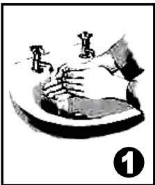
Se laver soigneusement les mains